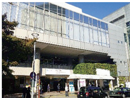
最寄り駅 (本川越駅)

事務所統合につきましては、令和7年の5月中旬に決定し、7月12日が引っ越し日でした。2ヶ月足らずの期間に通常業務の他に、お客様へのお知らせや引っ越しの準備等急ピッチで進めました。引っ越しが無事完了した時はほっとしたことを覚えています。