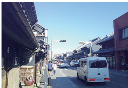
蔵づくりの 町並み